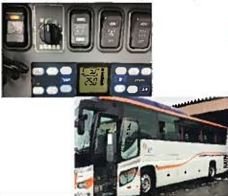
【9. 外気導入換気モード、窓の随時開放】