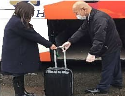
【7. 手荷物受渡時のマスク、手袋着用】