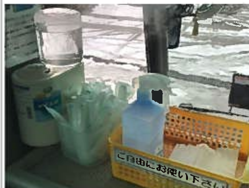
【4. 消毒液の常備装備】