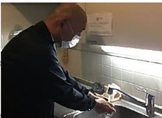
【2. マスク着用、手洗い励行の確実な実施】