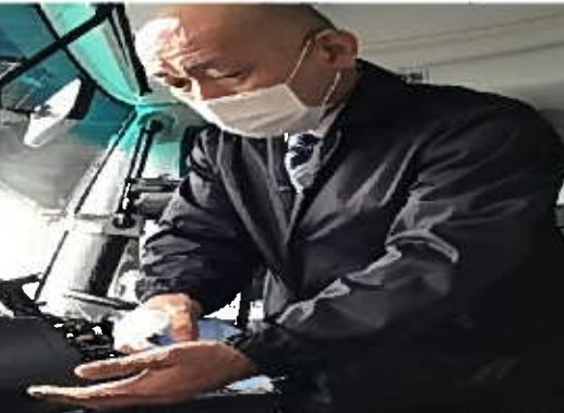
【6. 利用者乗降支援後の手指消毒】