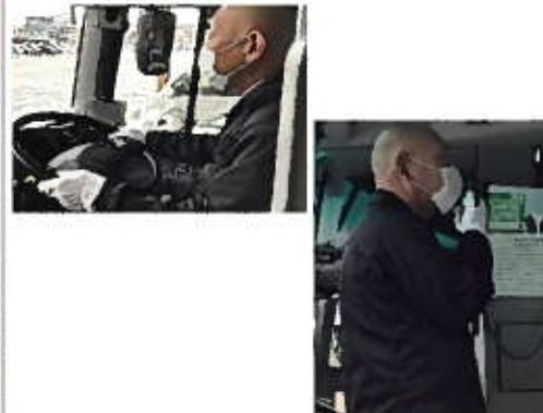
【8. 運転時、アナウンス時のマスクの着用】