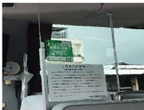
【3. 運転席と利用者との仕切り、換気】