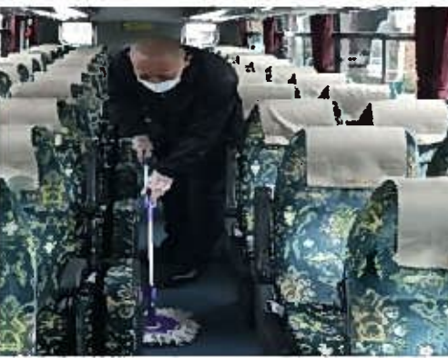
【11. 清掃時のマスク、手袋着用の徹底】