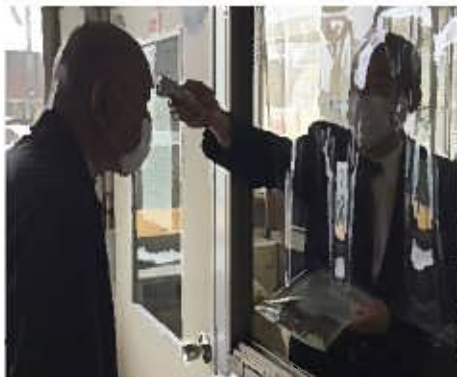
【1. 乗務員の点呼時の健康チェック】