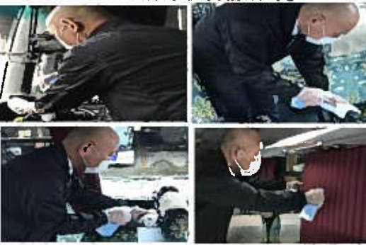
【10. 運転席周り、手すり等の清拭消毒、カーテンの消毒液噴霧消毒】