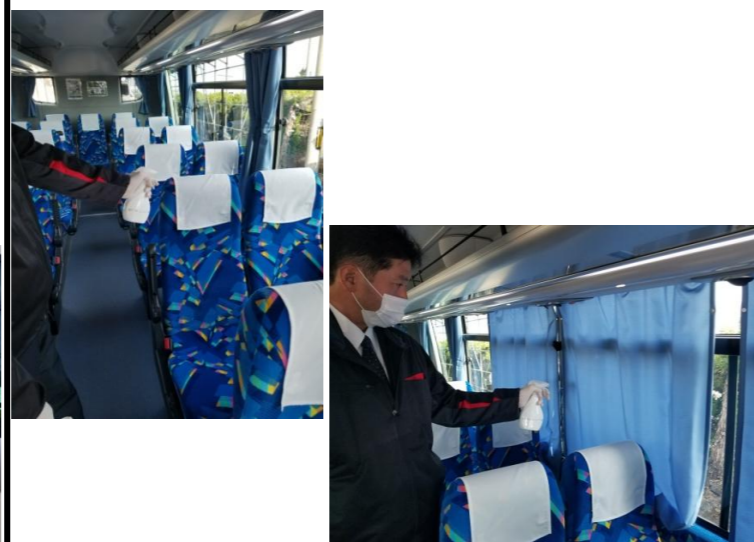
【10. 運転席周り、手摺り等の清拭消毒、カーテンの消毒液噴霧消毒】