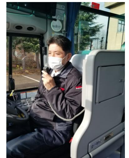
【8. 運転時、アナウンス時のマスク着用】