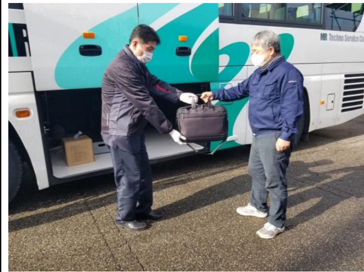
【7. 手荷物受渡時のマスク、手袋着用】