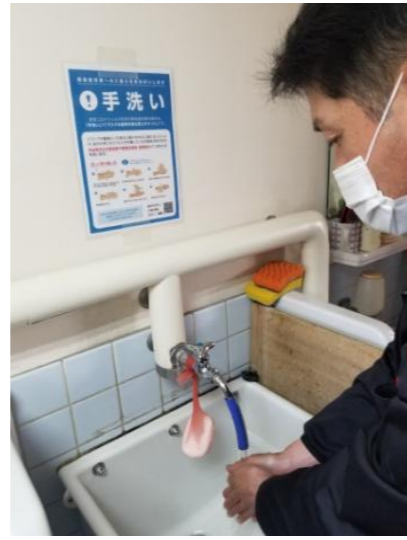
【2. マスクの着用、手洗い励行の確実な実施】