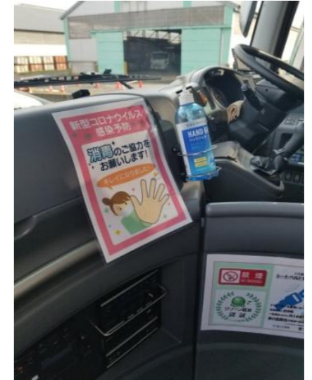
【4. 消毒液の常備装備】