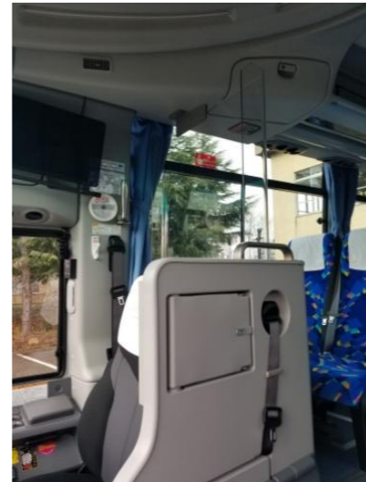
【3. 運転席と利用者との仕切り、換気】