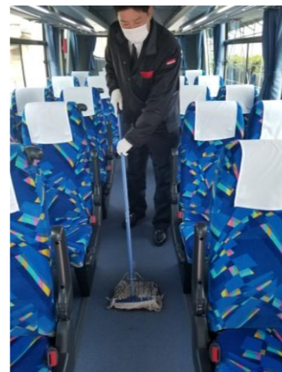
【11. 清掃時のマスク、手袋着用の徹底】