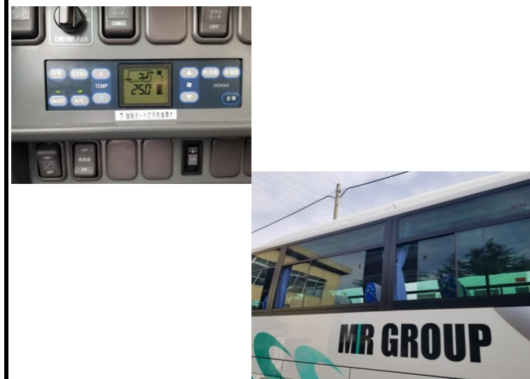
【9. 外気導入換気モード、窓の随時開放】