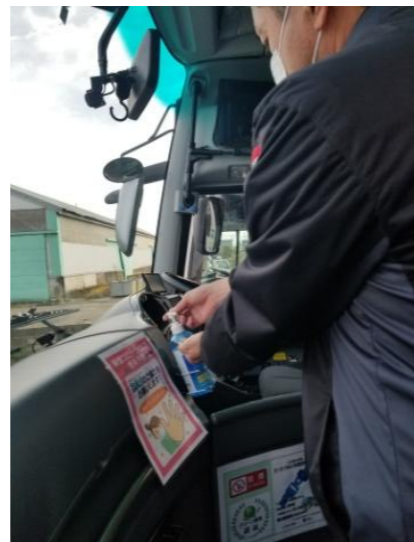
【6. 利用者乗降支援後の手指消毒】