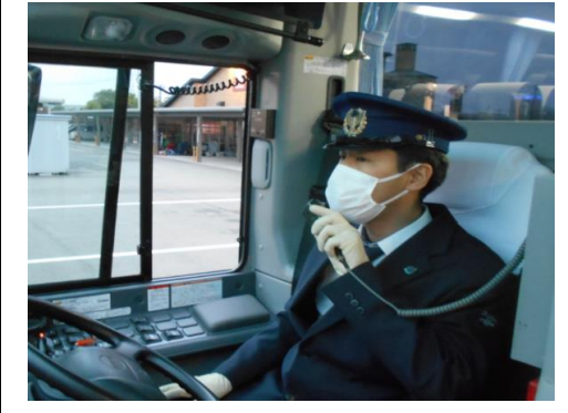
8.運転時、アナウンス時のマスク着用