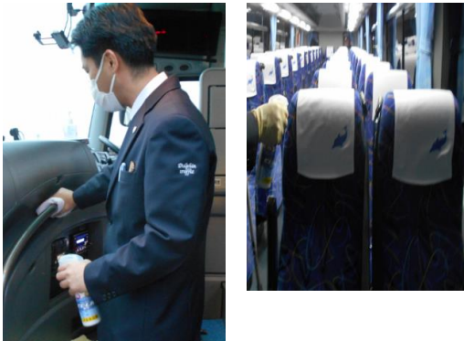
5.手すり・接触箇所等の消毒