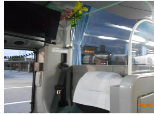
3.運転席と利用者との仕切り、換気