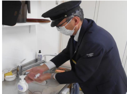
2.マスク着用、手洗い励行の確実な実施