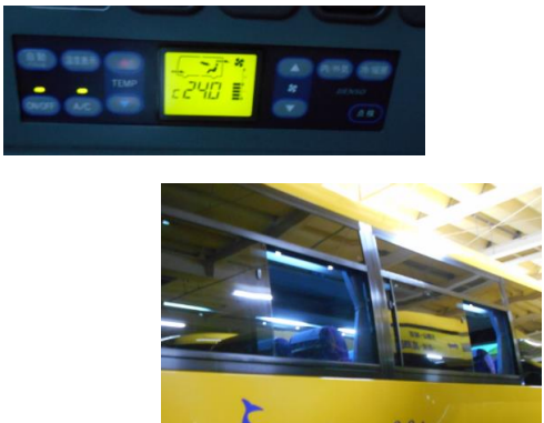
9.外気導入換気モード、窓の随時開放