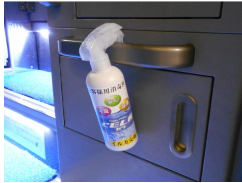
6.利用者乗降支援後の手指消毒