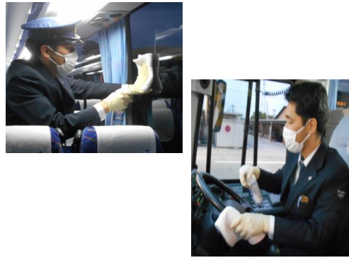
10.車内、各使用箇所等の拭拭消毒