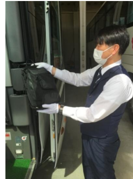
【7. 手荷物受渡時のマスク、手袋着用】