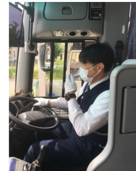
【8. 運転時、アナウンス時のマスクの着用】