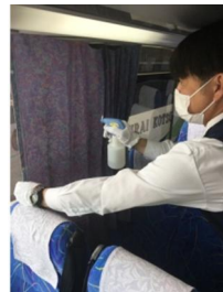
【10. 運転席周り、手すり等の清拭消毒、カーテンの消毒液噴霧消毒】