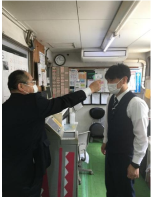
【1. 乗務員の点呼時の健康チェック】