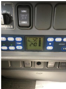
【9. 外気導入換気モード、窓の随時開放】