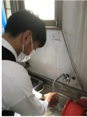
【2. マスク着用、手洗い励行の確実な実施】