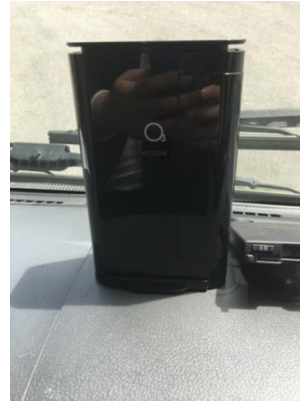
【3. オゾン発生器による車内除菌】