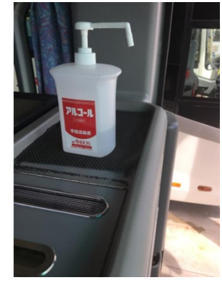
【4. 消毒液の常備装備】