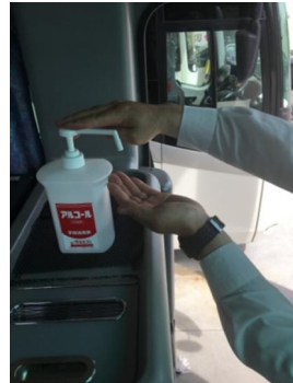
【6. 利用者乗降支援後の手指消毒】