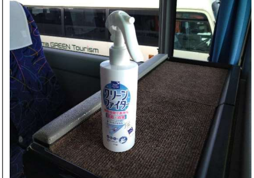
【4. 消毒液の常備装備】