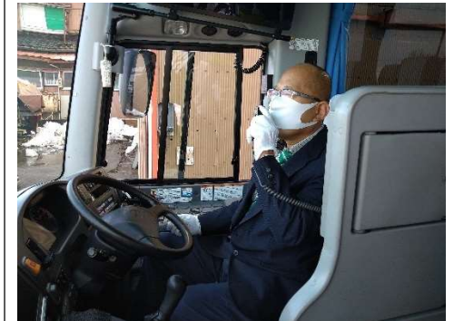
【8. 運転時、アナウンス時のマスクの着用】