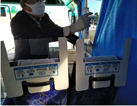
【11. 清掃時のマスク、手袋着用の徹底】