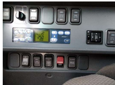
【9. 外気導入換気モード、窓の随時開放】