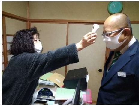
【1. 乗務員の点呼時の健康チェック】