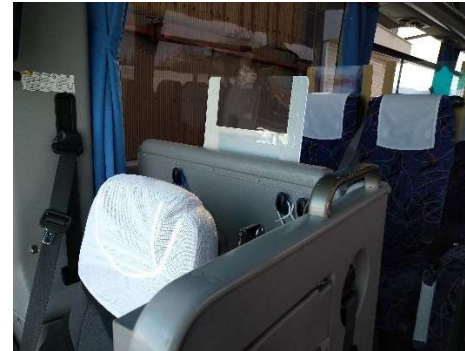
【3. 運転席と利用者との仕切り、換気】