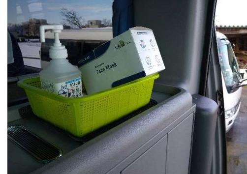
【6. 利用者乗降支援後の手指消毒】