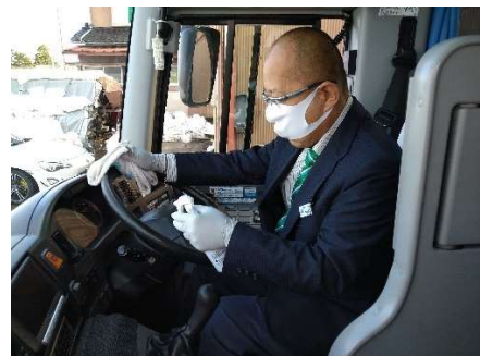
【10. 運転席周り、手すり等の清拭消毒、カーテンの消毒液噴霧消毒】