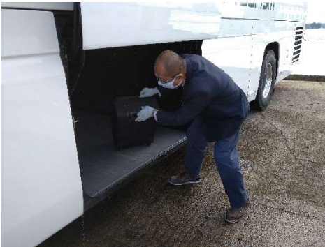
【7. 手荷物受渡時のマスク、手袋着用】