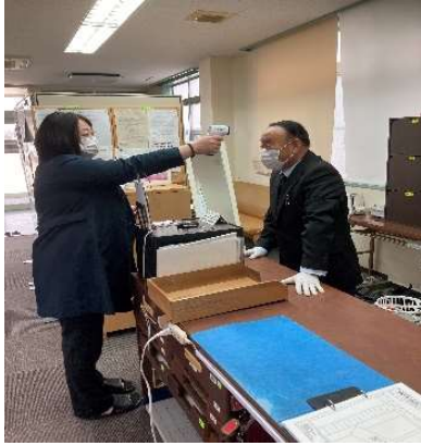
【1. 乗務員の点呼時の健チェック】