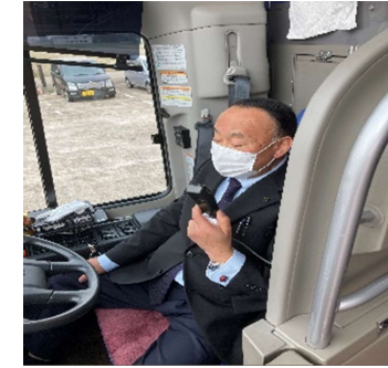
【8. 運転時、アナウンス時のマスクの着用】