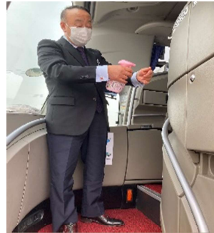
【6. 利用者乗降支援後の手指消毒】