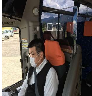
【3. 運転席と利用者との仕切り、換気】