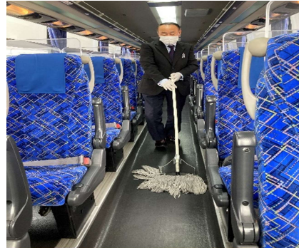
【11. 清掃時のマスク、手袋着用の徹底】