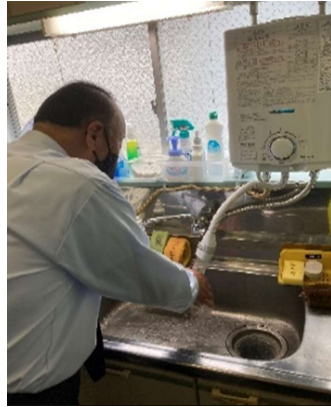
【2. マスク着用、手洗い励行の確実な実施】