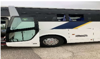
【10. 運転席周り、手すり等の清拭消毒、カーテンの消毒液噴霧消毒】