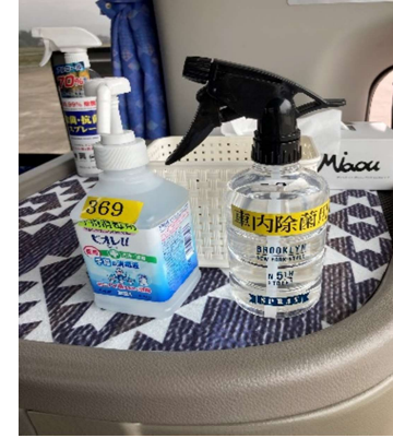
【4. 消毒液の常備装備】