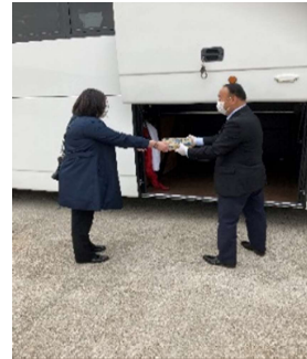
【7. 手荷物受渡時のマスク、手袋着用】