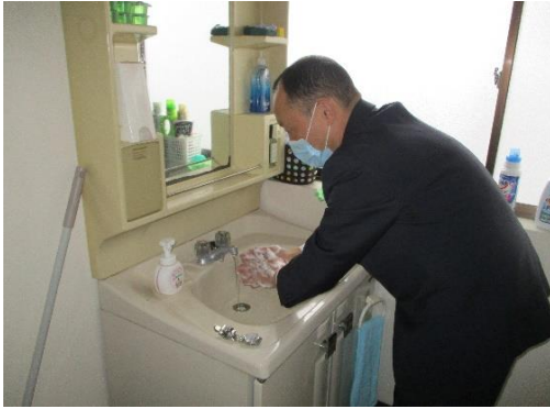
【2.マスク着用、手洗い励行の確実な実施】