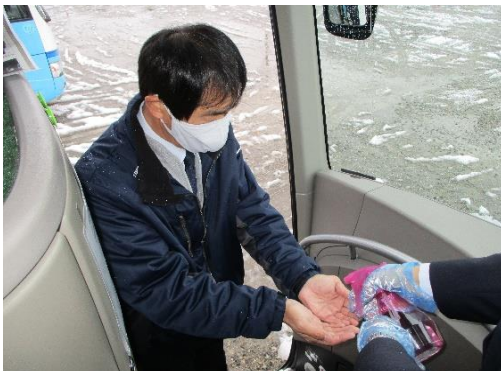
【6.利用者乗降支援後の手指消毒】