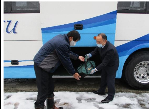
【7.手荷物受渡時のマスク、手袋着用】