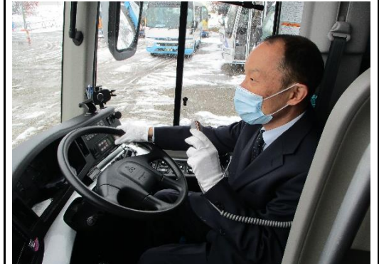
【8.運転時、アナウンス時のマスクの着用】