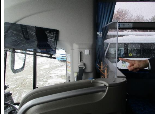
【3.運転席と利用者との仕切り、換気】