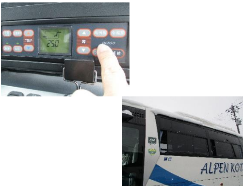
【9.外気導入換気モード、窓の随時開放】