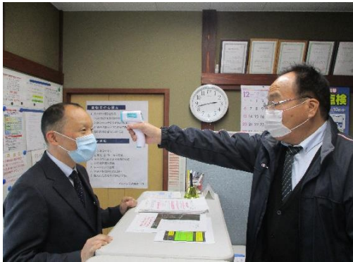
【1.乗務員の点呼時の健康チェック】