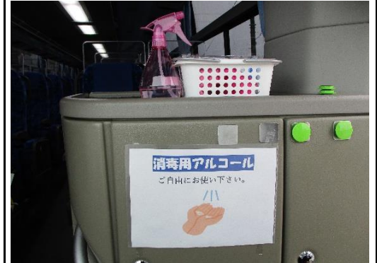
【4.消毒液の常備装備】