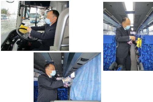
【10.運転席周り、手すり等の清拭消毒、カーテンの消毒液噴霧消毒】