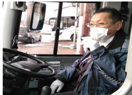
【6. アナウンス時のマスク手袋着用】