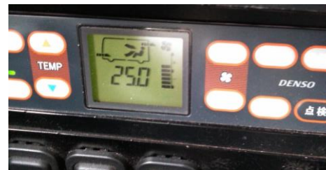
【11. 外気導入換気モード、窓の適時開放】