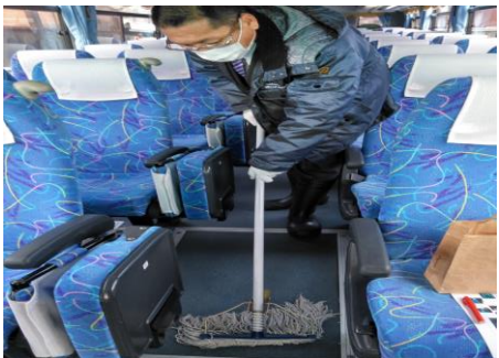
【9. 清掃時のマスク、手袋の着用】