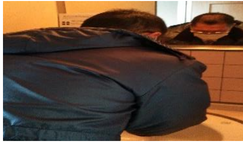
【2. マスク着用 手洗い 励行の 確実な 実施】