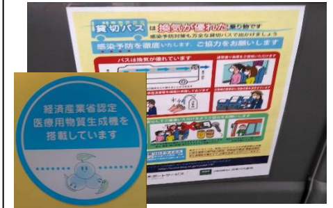
【4. ガイドラインの周知など】