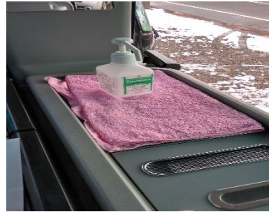
【3. 消毒液の常備装備】