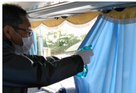
【10. カーテンの消毒液噴霧消毒】