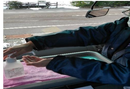
【7. 利用者乗降支援後の手指消毒】