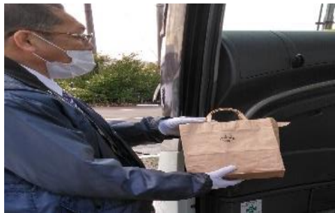
【5. 手荷物受渡時のマスク手袋着用】