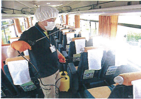
【1.抗菌処理作業風景(1)】