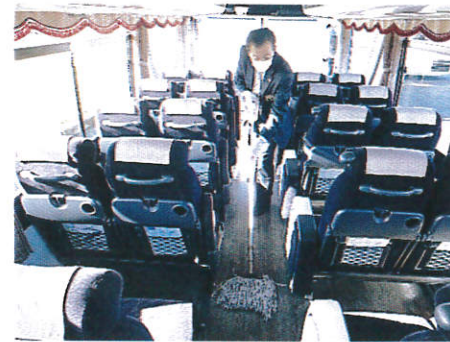
【11.清掃時のマスク、手袋着用の徹底】