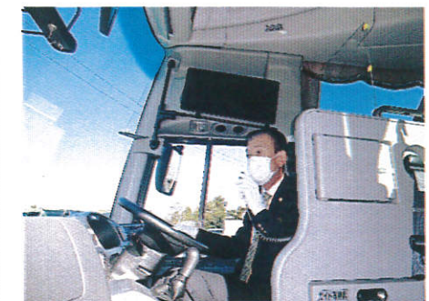
【8.運転時、アナウンス時のマスクの着用】