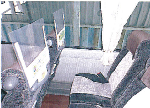
【5.座席飛沫防止用シールド/側面】