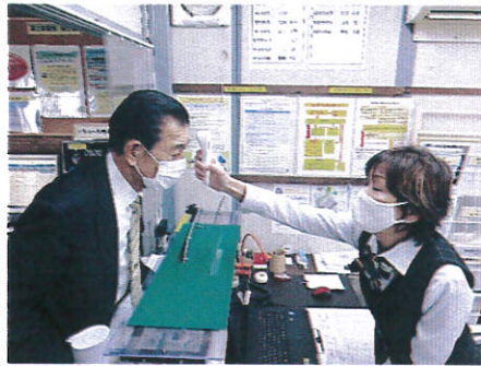
【1.乗務員の点呼時の健康チェック】