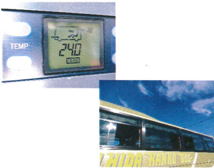
【9.外気導入換気モード、窓の随時開放】