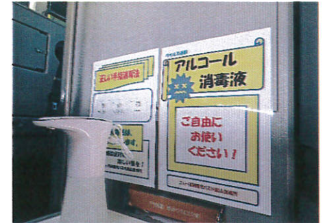
【4.消毒液の常備装備】