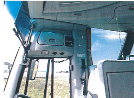
【3.運転席と利用者との仕切り、換気】