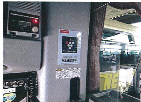
【6.プラズマクラスター設置済周知(1)】