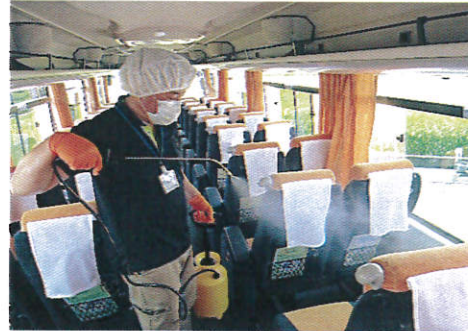
【2.抗菌処理作業風景(2)】