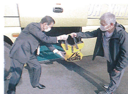
【7.手荷物受渡時のマスク、手袋着用】