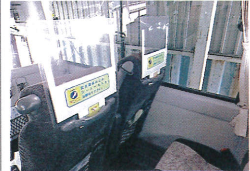
【4.座席飛沫防止用シールド/後方】