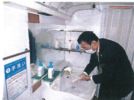
【2.マスク着用、手洗い励行の確実な実施】