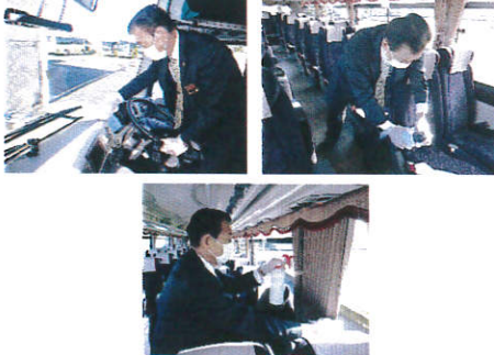
【10.運転席周り、手すり等の清拭消毒 カーテンの消毒液噴霧消毒】