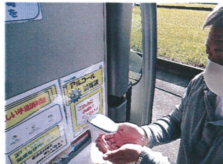
【6.利用者乗降支援後の手指消毒】