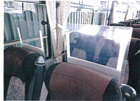
【3.座席飛沫防止用シールド/前面】