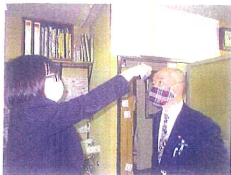
乗務員の点呼時の健康チェック