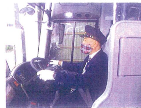
マスクと手袋着用