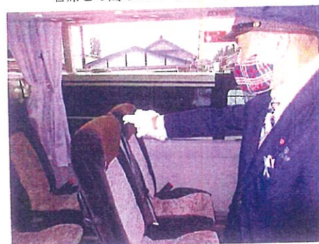
ヘッドレストの消毒