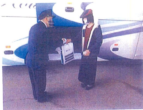
手荷物受取時の手袋着用