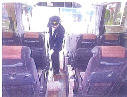
清掃時のマスク手袋着用