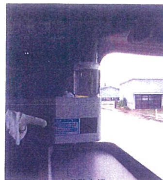
消毒液の自動散布機