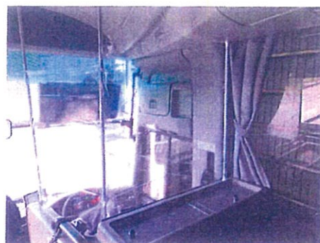
客席との間のビニールシート