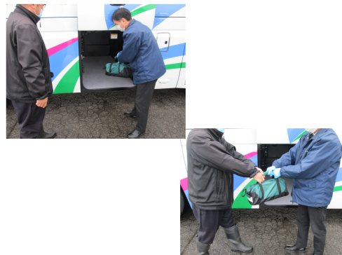
【7. 手荷物受渡時のマスク、手袋着用】