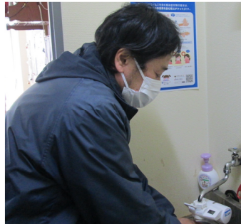
【2. マスク着用、手洗い励行の確実な実施】