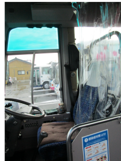
【3. 運転席と利用者との仕切り、換気】