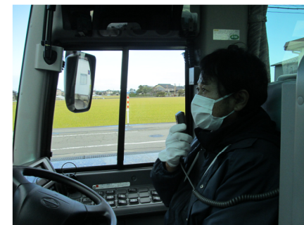
【8. 運転時、アナウンス時のマスクの着用】