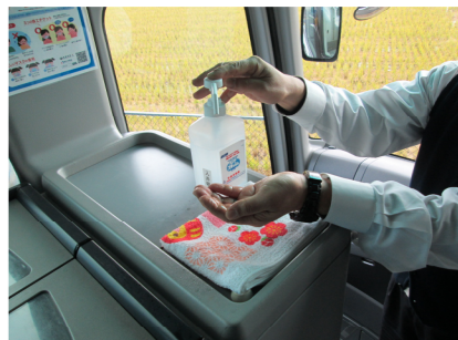
【6. 利用者乗降支援後の手指消毒】