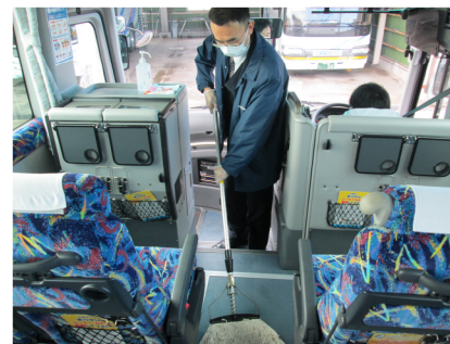
【11. 清掃時のマスク、手袋着用の徹底】