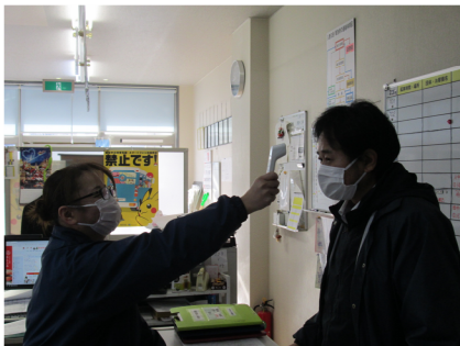
【1. 乗務員の点呼時の健康チェック】