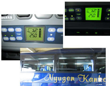
【9. 外気導入換気モード、窓の随時開放】