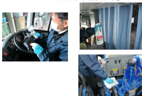
【10. 運転席周り、手すり等の清拭消毒、カーテンの消毒液噴霧消毒】