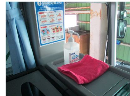
【4. 消毒液の常備装備】