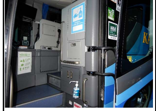
【4.消毒液の常備装備】