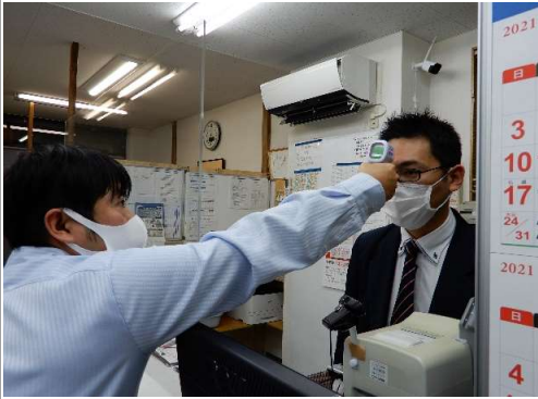
【1.乗務員の点呼時の健康チェック・マスク着用】