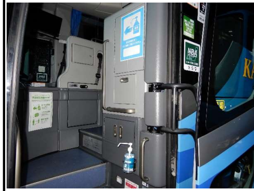
【6.利用者乗降支援後の手指消毒】