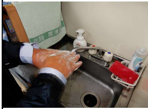
【2.手洗い励行の確実な実施】