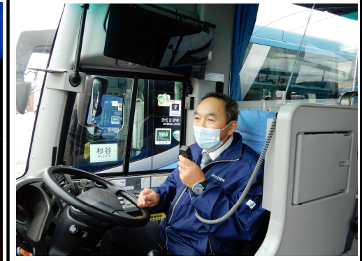
【8.運転席、アナウンス時のマスクの着用】