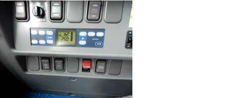
【9.外気導入換気モード、窓の随時開放換気】