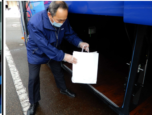
【7.手荷物受渡時のマスク、手袋着用】