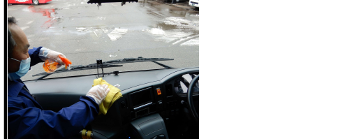
10.【運転席周り、手すり等清拭消毒等】