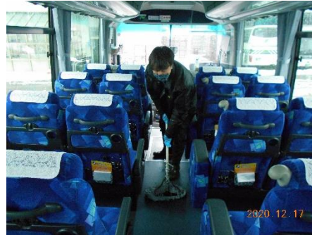
【11. 清掃時のマスク、手袋着用の徹底】