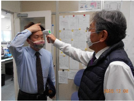
【1. 乗務員の点呼時の健康チェック】