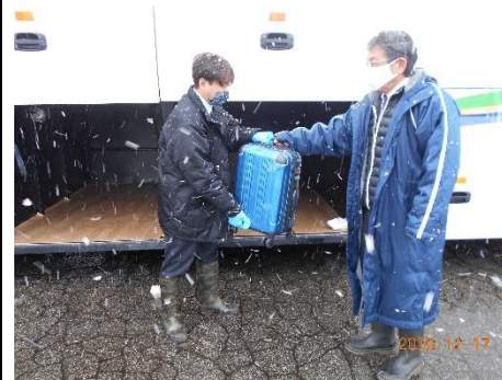
【7. 手荷物受渡時のマスク、手袋着用】