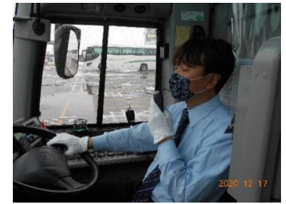
【8. 運転時、アナウンス時のマスクの着用】