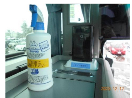
【4. 消毒液の常備装備】