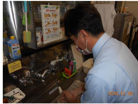
【2. マスク着用、手洗い励行の確実な実施】