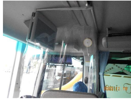
【3. 運転席と利用者との仕切り、換気】