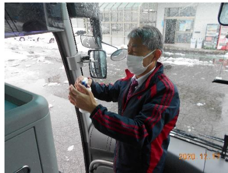
【6. 利用者乗降支援後の手指消毒】